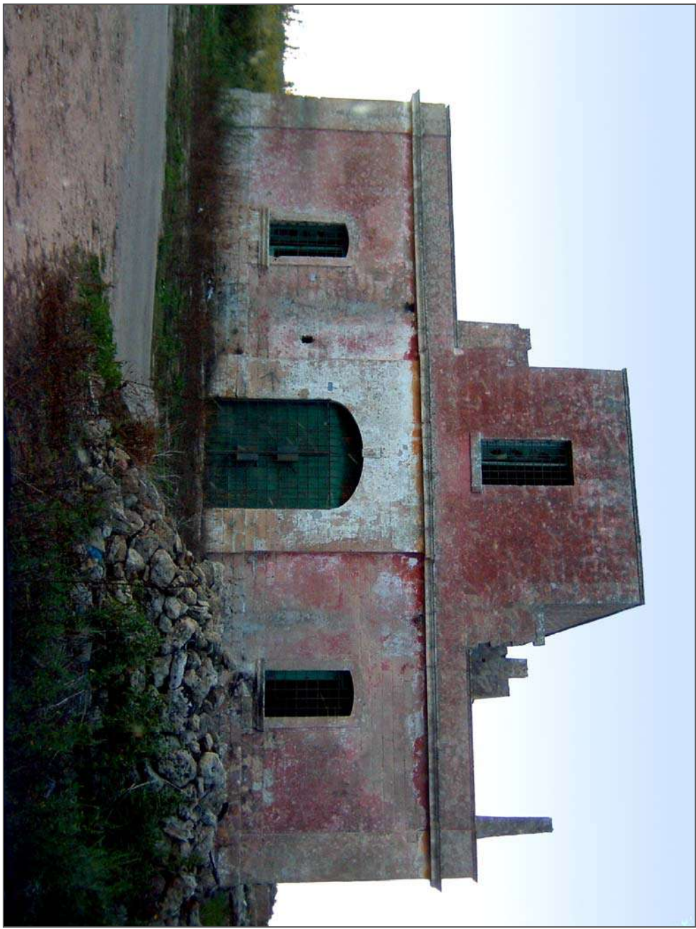
Fotogramma 3. MASSERIA "GRANDE" (fronte)