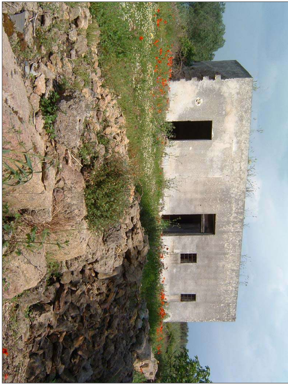
Fotogramma 1. CASA COLONICA (da Ovest)