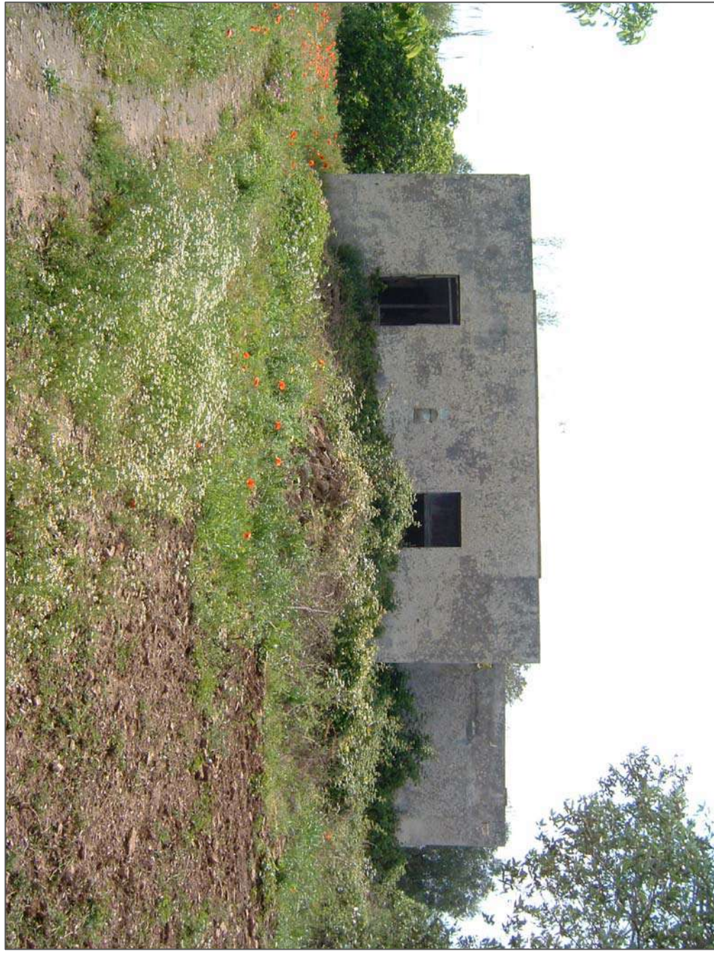
Fotogramma 2. CASA COLONICA (da Est)