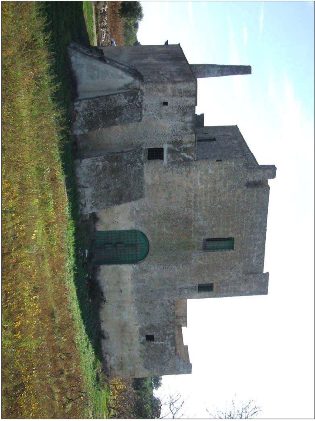
Fotogramma 4. MASSERIA "GRANDE" (retro)